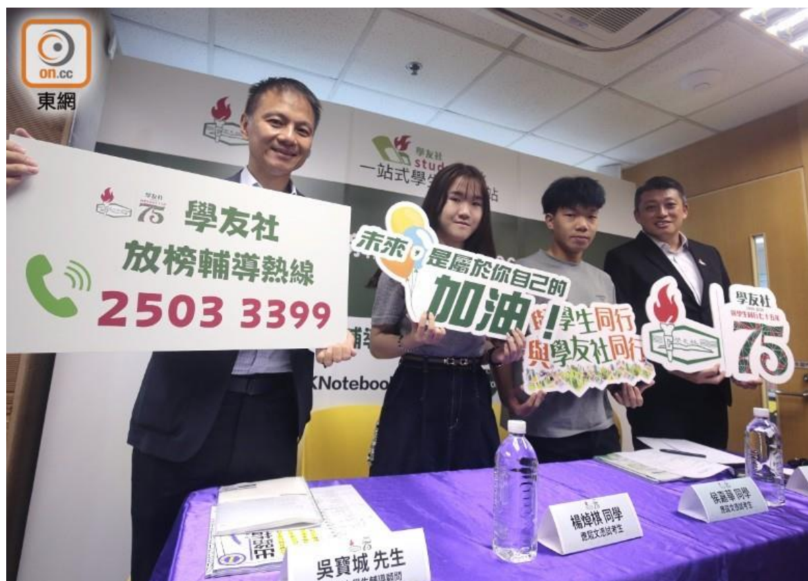
學友社預計，今年大學聯招競爭形勢與去年相若。